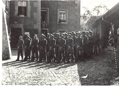
Die Vsg Trp UOS 273/84 anlässlich der Brevetierungsfeier im Hof der Commanderie La Planche, Fribourg