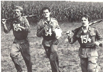
Mit vollem Einsatz dem Ziel entgegen

Die freiwilligen Wettkämpfer der Sommermeisterschaften erfreuen sich in der Felddivision 5 und in der Grenzbrigade 5 vermehrter Beliebtheit: Gegenüber dem Vorjahr steigerte sich die Zahl der startenden Wehrmänner erheblich. Waren es 1983 noch gut 1000 Soldaten, Unteroffiziere und Offiziere, die ihre körperliche Leistungsfähigkeit unter Beweis stellten, so traten in Muri über 1200 Wehrmänner zu den Meisterschaften an.