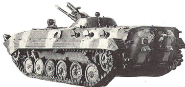
BMP (SU) Kampfschützenpanzer

Die wichtigsten Unterscheidungsmerkmale von BMP und BMD lassen sich aus der folgenden Gegenüberstellung unschwer herauslesen.