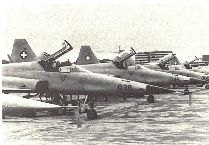
Maschinen des Typs Tiger startbereit auf dem Dübendorfer Flugfeld.