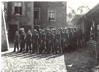
Die Vsg Trp UOS 273/84 anlässlich der Brevetierungsfeier im Hof der Commanderie La Planche, Fribourg