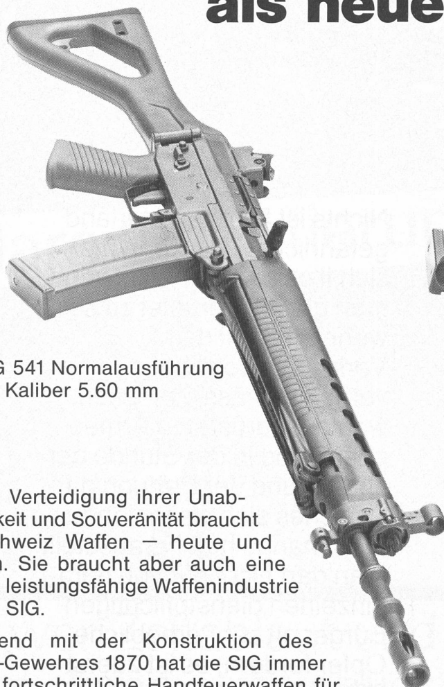
SG 541 Normalausführung im Kaliber 5.60 mm