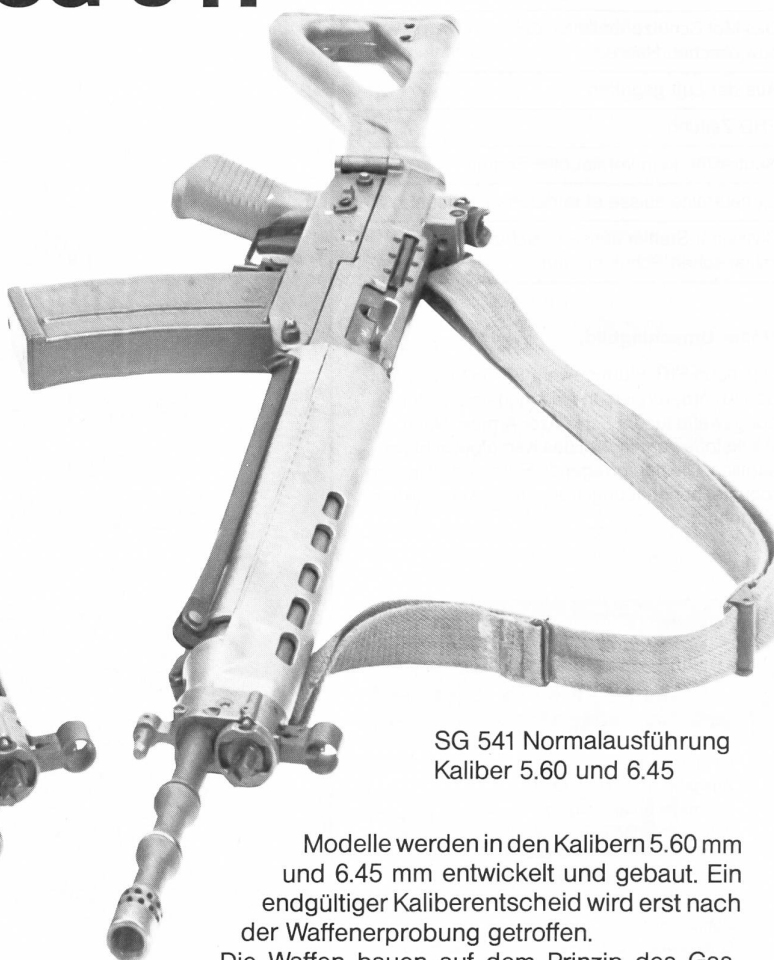
SG 541 Normalausführung Kaliber 5.60 und 6.45

Für die Verteidigung ihrer Unabhängigkeit und Souveränität braucht die Schweiz Waffen — heute und morgen. Sie braucht aber auch eine eigene, leistungsfähige Waffenindustrie wie die SIG.