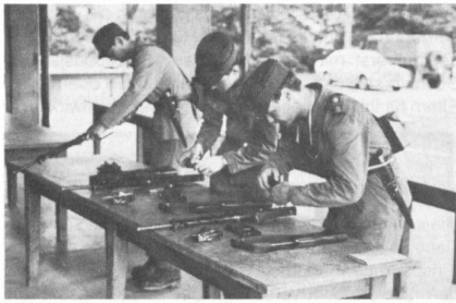
Postenarbeit Stgw «Kleine Zerlegung».

Vor ihrer Beförderung zum Korporal mussten die 56 Uof Anwärter der Vsg Trp UOS 273 am 7. Juli 1983 einen Patrouillenlauf als Wettkampf mit folgender Zielsetzung bestreiten: