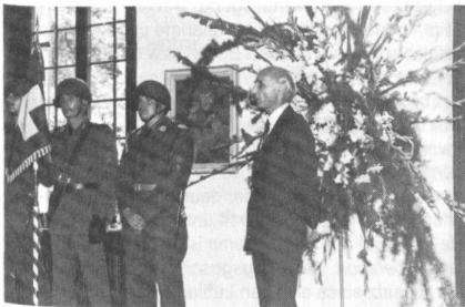
Erzieher zu Erzieher: Regierungsrat Alfred Gilgen, Erziehungsdirektor des Kantons Zürich, spricht zu den jungen Unteroffizieren.