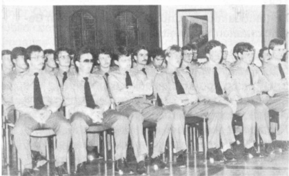
32 erwartungsvolle Gesichter: Was werden die nächsten 17 Wochen bringen?