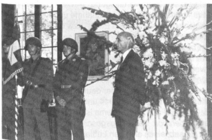
Erzieher zu Erzieher: Regierungsrat Alfred Gilgen, Erziehungsdirektor des Kantons Zürich, spricht zu den jungen Unteroffizieren.