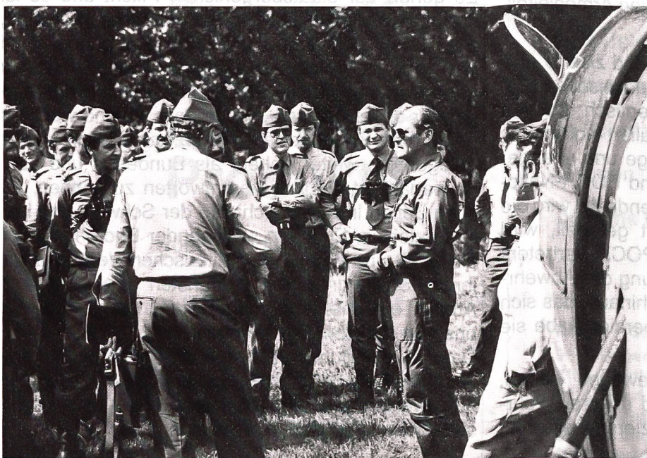
Auf grosses Interesse stiess bei den Zentralschülern auch eine Helikopterdemostration auf dem Churer Rossboden.

Zur Erreichung der Zielsetzung der Zentralschulen sind taktische Übungen im Gelände, bei denen die Schüler ihre theoretischen Kenntnisse an praktischen Beispielen anzuwenden haben, die wohl wichtigste Unterrichtsform. Theorien über die Mittel und Möglichkeiten des Gegners, andere Waffengattungen und Dienstzweige frischen die militärischen Kenntnisse der Teilnehmer auf und erweitern sie. Dabei wird aber auch dieser taktische Theorieunterricht in engster Beziehung zu den