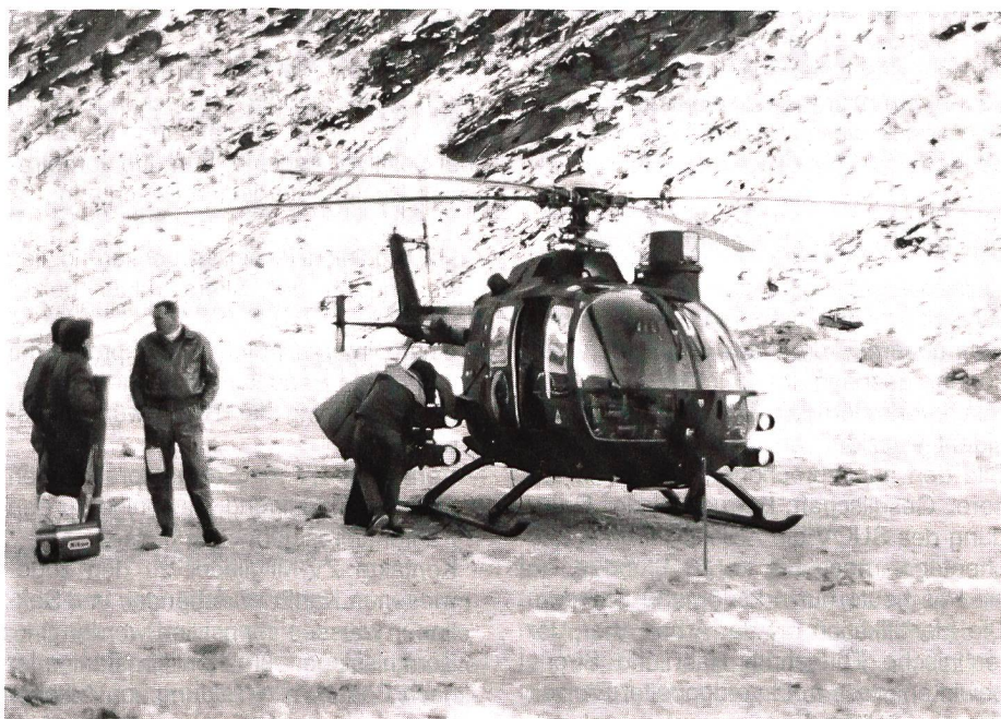
Der Panzerabwehrhelikopter BO-105 CB der Firma Messerschmitt-Bölkow-Blohm (MBB) in Hinterrhein. An seitlichen Abschussvorrichtungen kann er 8 Lenk Waffen des Typs «TOW» mitführen. Der Aufbau über der linken Seite der Kabine stellt die optische Zielvorrichtung dar. WSCHM

Da ein generelles Interesse unserer Armee für Panzerabwehrhelikopter besteht, so die Mitteilung des EMD, fanden in der Zeit vom 20. bis 25. November 1981 auf dem Panzerschiessplatz Hinterrhein technische Schiessversuche statt. Die deutsche Firma Messerschmitt-Bölkow-Blohm (MBB) in Ottobrunn bei München, anbot sich, dem EMD ihren Mehrzweckhelikop-