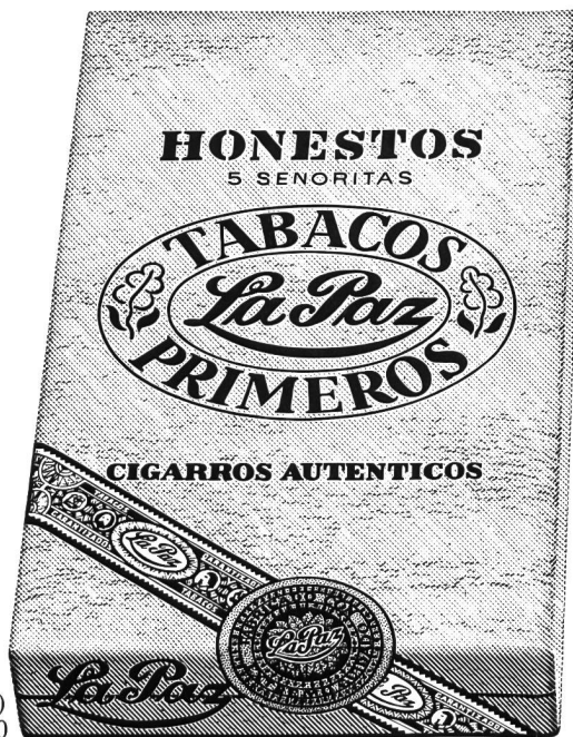
Honestos (Senoritas) 5 Stück Fr. 3.50