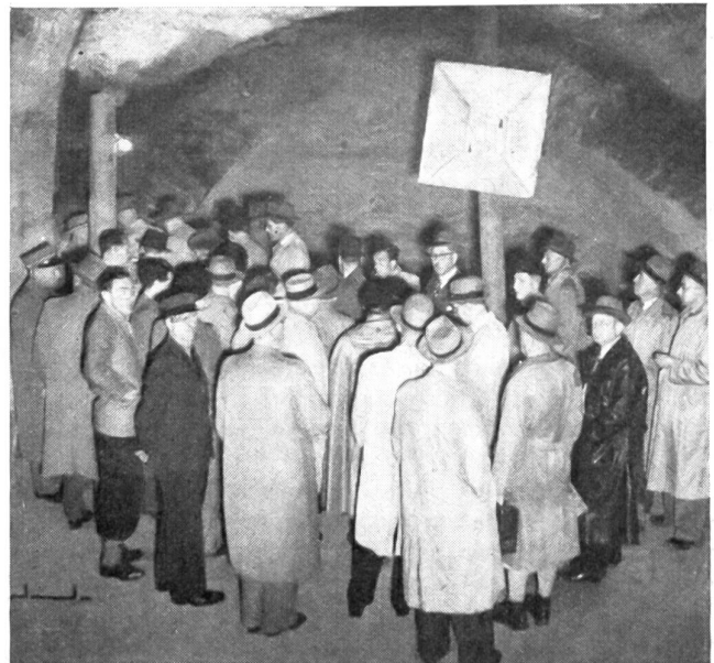
Bundesrat Kobelt, Chef des Eidg. Militärdepartementes, erklärt den Pressevertretern den Vorgang des Unglückes.