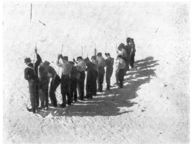
Lavinendienst. Die Offiziersklasse beim Sondieren.

Bereits wird in der Berner Division das Ziel wieder weitergesteckt. Vom 18. bis 28. August findet auf der Furka der nächste freiwillige Sommergebirgskurs statt, für den bereits eine stattliche Zahl von Klassenlehrern und Kursteilnehmern gemeldet sind. Auf Wiedersehen im Sommer auf der Furka!