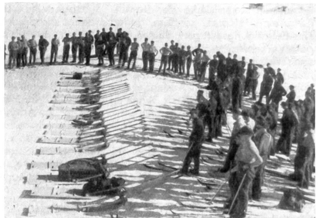
Der Skikurs ist zu einer Demonstration über die Verwendung der Kanadier angetreten.

Nach diesen dreieinhalb Tagen, die bereits mit kleinen Trainingsmärschen auf Fellen dotiert waren, erfolgte als erste Tour die Besteigung des Winterhorns. Mehr als die Hälfte des Kurses erreichte den Gipfel, während der Rest die als Klassenziel bezeichneten Punkte Hühneregg und P. 2181 am Winterhorn erreichten. Die Abfahrt erwies sich