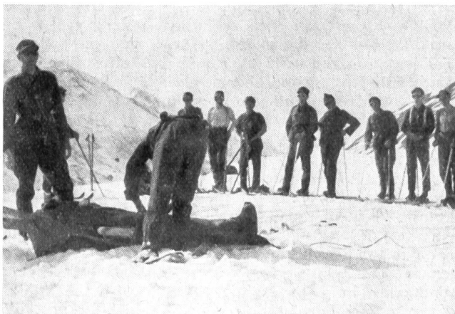
Auch das will gelernt sein! Demonstration über die Maßnahmen bei Unfällen und das richtige Verpacken des Verletzten.

Am Samstagmorgen, dem 27. Februar, konnte der ganze Kurs gesund und braungebrannt wieder entlassen werden. Daß diese zehn Tage ohne ernstlichen Unfall verliefen, stellt der Leitung und den Klassenlehrern das schönste Zeugnis aus und belohnt das Bestreben, nichts zu forcieren und stets daran zu denken, daß jeder Kursteilnehmer nicht