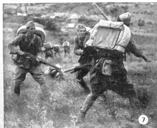
Das türkische Sandhurst