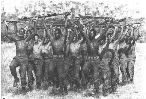
1 Schwarze und weiße Soldaten des 41. Bataillons beim drillmässigen Fitnessstraining.

Südwestafrika, auch Namibia genannt, ist ein Territorium der Republik Südafrikas mit eigener parlamentarischer Vertretung. Auf einer Fläche von 824 292 km 2 leben etwa 720 000 Einwohner, Schwarze und Weiße. Gemeinsamer Feind ist die von den Ostblockstaaten ausgebildete und (über Angola und Sambia) mit Waffen unterstützte Terror- und Guerillaorganisation SWAPO. Deren Tätigkeit möglichst zu unterbinden und die zivile Bevölkerung gegen die Mordkommandos zu schützen, ist Aufgabe der gemischtrassigen südwestafrikanischen Armee und ihrer Anti-Guerillaeinheiten. – Unser Mitarbeiter Stefan Sonderling hat sich bei diesen Spezialisten des Kleinkrieges aufgehalten, hat ihre Ausbildung und ihre Einsätze verfolgt. H