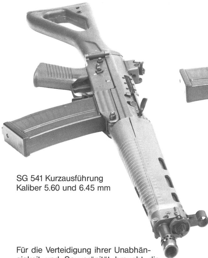
SG 541 Kurzausführung Kaliber 5.60 und 6.45 mm