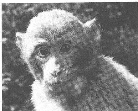
Porträt eines Berberaffen, wie sie zu Hunderten auf dem «Affenberg» bei Salem (in der Nähe von Meersburg) im freien Gelände gehalten werden

men mit ihren Angehörigen in der Sternwarte Kreuzlingen viele spannende Neuigkeiten aus der Sternenforschung mitteilen lassen. Ein weiterer Ausflug führte die Unteroffiziere ins benachbarte Deutschland, wo die bekannte Forschungsstation «Affenberg» besucht werden konnte. Hier werden in einem grossen Waldgelände Hunderte von Berberaffen gehalten und ihre Verhaltensweisen beobachtet. Die Besucher können auf markierten Wegen durch den Park spazieren und in hautnahen Kontakt mit den putzigen Tieren gelangen. Alle diese Anlässe sollen mithelfen, nicht nur technische Fertigkeiten an Waffen und Geräten zu erlangen, sondern auch Kameradschaft und Zusammengehörigkeit zu üben. IBST