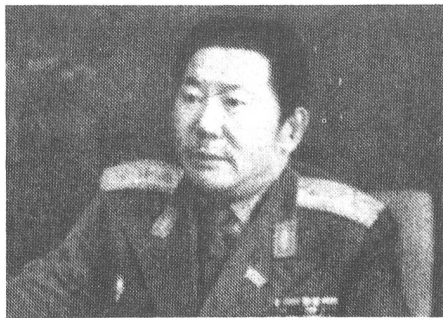
Generaloberst Sharantain Avchia, Minister für Verteidigung der Mongolischen Volksarmee.

Die Geschichte begann eigentlich im November 1920. In diesem Zeitpunkt war die Mongolei als Königreich ein Pufferstaat zwischen Russland und China. Obwohl juristisch unabhängig, stand das Land nach dem Sturz der Monarchie in Russland unter starkem chinesischen Einfluss. Nach dem Sieg Lenins und der Ausdehnung der bolschewistischen Herrschaft über den Ural fanden zahlreiche Weissgardisten in der Mongolei eine Bleibe, wo sie sich in verschiedene Gruppen organisierten. Es stand freilich nicht im Interesse der Sowjetregierung, einen gegnerischen Nukleus unmittelbar an der Grenze des angehenden sowjetischen Imperiums zu dulden. Deswegen liessen Lenins Emissäre aus einer zahlenmässig unbedeutenden Gruppe von etwa 160 mongolischen Sympathisanten am 1. März 1921 eine «Volkspartei» bilden, um sie kaum zwei Wochen später unter der Führung von Sucho-Bator als «Volksregierung» auszurufen.