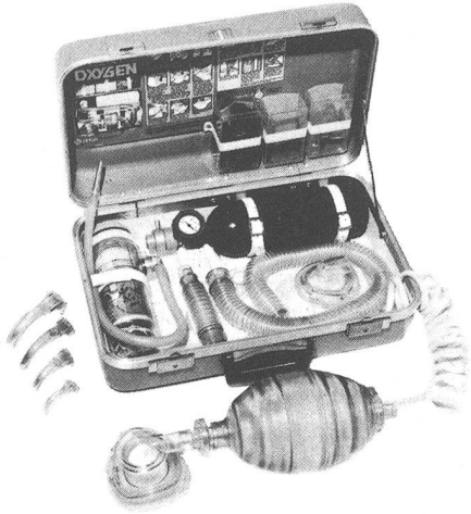
Erste-Hilfe-Koffer Modell Modulaide Oxygen Jet