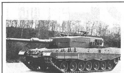
Spezialpanzerungen und verbesserte Feuerkraft und Beweglichkeit moderner Kampfpanzer stellen die Panzerabwehr vor Probleme

Bürgertums vor gewaltsam revolutionären Umbruchversuchen, und die – auch vom Bundesrat geteilte – Erwartung, dass der Kampf der Linken gegen die bürgerliche Ordnung nach dem Zusammenbruch des grossen Streiks neu aufleben werde, führten im November 1918 an verschiedenen Orten der Schweiz zur Aufstellung von Bürgerwehren. Diese wurden aus Freiwilligen rekrutiert und machten sich den Schutz des öffentlichen und privaten Eigentums und der persönlichen Freiheit der Bürger zur Hauptaufgabe, wenn die staatlichen Organe (Polizei und Armee) dazu nicht in der Lage sein sollten. Als Dachorganisation der einzelnen Bürgerwehren wirkte der Schweizerische Vaterländische Verband, dessen geistiges Schwergewicht im Kanton Aargau lag. Die Ende 1918 gebildeten Bürgerwehren haben vor allem im Generalstreik von Basel vom 1. August 1919 eine aktive Rolle gespielt. Im zweiten Weltkrieg kam es nicht zur Bildung von Bürgerwehren. Die erfolgreiche militärische Einrichtung der Ortswehren erfasste alle zur Erhaltung der Heimat bereiten Kräfte zur Erfüllung mannigfacher Hilfsaufgaben. Dagegen fand die Idee der Bürgerwehren nach dem Krieg im Berner Jura, bei den Anschlägen gegen Kernkraftwerke und bei den jüngsten Jugendkrawallen neue Anwendungsbereiche.