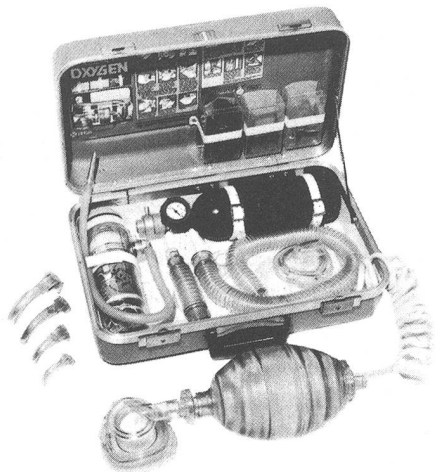
Erste-Hilfe-Koffer Modell Modulaide Oxygen Jet