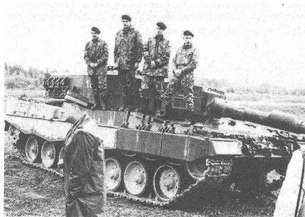
Oberst Maurer stellt die Crew des Leopard 2 vor. 3 Pz-Sdt und ein Uof.