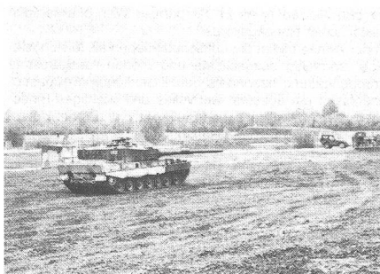
Der Panzerwagen Leopard 2 auf seinem 4-Phasen-Parcours

Nachdem die Soldaten – übrigens wie alle andern Sdt und Uof, die an einem Montag einrücken – das neue Panzermaterial gefasst hatten, ging es schon in den ersten Stunden in die Theorie. Vieles ist doch neu und musste zuerst geübt werden. Bereits am dritten Tag chauffierten die Fahrer den Leopard-Panzer und legten bereits über 160 Kilometer auf den Rauten zurück. Davon entfallen 7,5 Stunden auf den öffentlichen Verkehr. Die Arbeitszeit der Versuchstruppe beträgt 60 Stunden pro Woche – was eine respektable Zahl ist.