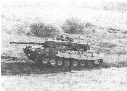
Leopard 2 in voller Fahrt in der Kampfsituation kurz vor der Deckung.