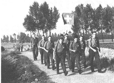
Alle Mannschaften der Schweizer Armee tragen in den Tagen von Nijmegen stolz die Standarte mit dem weissen Kreuz auf rotem Grund über Hollands Strassen.