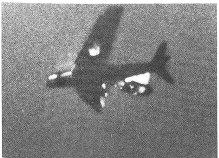
Das getroffene Zielflugzeug F-86 «Sabre» stürzt brennend ab.