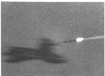
Die mit halbaktivem Radar ausgerüstete Sparrow-Lenkaffe trifft das Ziel. Von den drei abgeschossenen Lenkaffen wurden zwei direkte Treffer erzielt, und die dritte Lenkaffe passierte das Ziel innerhalb des Wirkungsbereiches des Kriegskopfes.