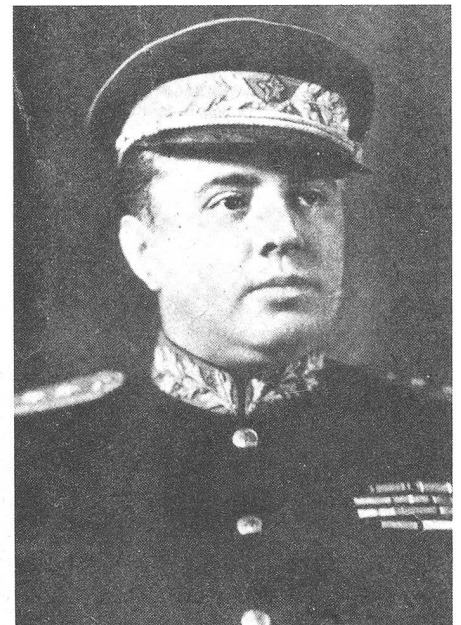
Parteichef und oberster Kriegsherr der Volksbefreiungsarmee Enver Hoxha in Generalsuniform

Dazu zählt man noch die paramilitärischen Formationen mit 13 000 Mann, die inneren Sicherheitskräfte mit 5000 Mann und Grenztruppen in der Höhe von 8000 Mann.