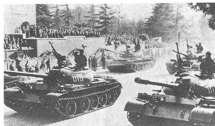
Panzer der Volksbefreiungsarmee defilieren vor der Parteiführung in Tirana am 28. November 1979.