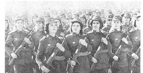
Paramilitärische Formationen an der Parade (Das Bild zeigt Studentinnen der Universität Tirana in Uniform)