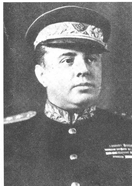
Parteichef und oberster Kriegsherr der Volksbefreiungsarmee Enver Hoxha in Generalsuniform

Dazu zählt man noch die paramilitärischen Formationen mit 13 000 Mann, die inneren Sicherheitskräfte mit 5000 Mann und Grenztruppen in der Höhe von 8000 Mann.