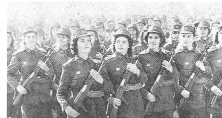
Paramilitärische Formationen an der Parade (Das Bild zeigt Studentinnen der Universität Tirana in Uniform)