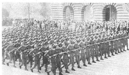
Parade der Volksbefreiungsarmee in Tirana am 28. November 1979