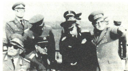
Die Beobachter des sowjetischen Manövers aus den sozialistischen Bruderländern (v.l.n.r.: u.a. DDR-Verteidigungsminister Heinz Hoffmann, Lajos Czinégy, Ungarns Verteidigungsminister, Martin Dzur, Verteidigungsminister der CSSR)

In dem Manöver wurden diverse Verbände und Truppenteile in einer Gesamtstärke von über 100 000 Mann zum Einsatz gebracht. Nach westlichen Beobachtungen hatte man auch 140 Einheiten aller vier Sowjetflotten in der westlichen Ostsee konzentriert – die grösste Flottenkonzentration in der Ostsee seit dem Zweiten Weltkrieg! Etwa 6000 Mann, Teile einer Division, wurden im Laufe des Manövers mittels 40 Luftkissenbooten und Landungsschiffen unter ungünstigen Witterungsverhältnissen auf's Land getan, d.h. mit ihnen eine Invasionsübung durchgeführt. Auch Luftlandetruppen kamen zum Einsatz. Die kombinierte Operation zu Lande, zu Wasser und in der Luft fand in einer gespannten politischen Lage an der sowjetisch-polnischen Grenze statt und diente nach westlichen politischen Kommentatoren nicht zuletzt der (erneuten) Einschüchterung der polnischen Bevölkerung. ATB