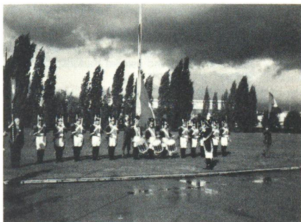
Les Vieux Grenadiers et les Piquiers 1602 de Genève hissen das Landesbanner.

Die 36. Jahrestagung der Veteranen-Vereinigung des SUOV fand am 11. Oktober 1981 in Genf statt. 1/3 der Teilnehmer leisteten der Einladung der Organisatoren Folge und reisten bereits am Samstag in die Stadt Calvins. Sie wurden in der Kaserne einquartiert und am frühen Abend ins Lokal der Genfer Sektion geführt, wo ihnen ein Ehrentrunk offeriert wurde. Ein gemeinsames Nachtessen setzte den Schlusspunkt des Abends. Am Sonntagmorgen, nachdem der Regen der Sonne gewichen war, konnte die Fahne in einem schlichten Zeremoniell unter Mitwirkung je einer Gruppe der «Vieux Grenadiers» und der «Piquiers 1602» in ihren historischen Uniformen, begleitet von einer Ehrensalue, Modell Napoleon, hochgezogen werden.