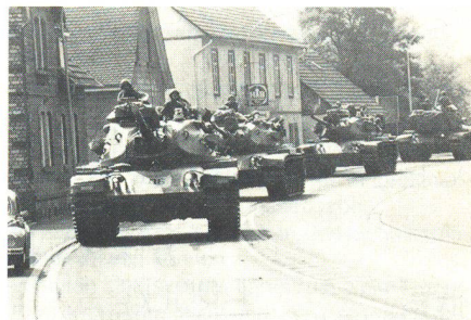
Gepanzerte US-Haubitze 155 m bei einer Ortsdurchfahrt