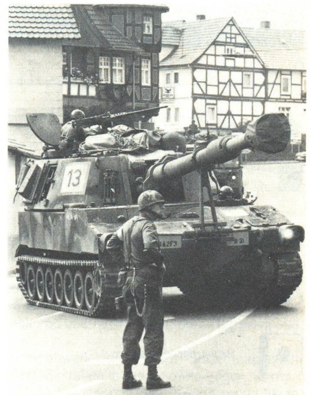
Kampfpanzer (M-60) der «B»-Kompanie des 33. US-Panzer-Bataillons beim Manöver «Certain Encounter»