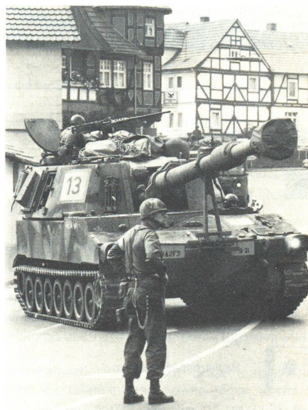
Kampfpanzer (M-60) der «B»-Kompanie des 33. US-Panzer-Bataillons beim Manöver «Certain Encounter»