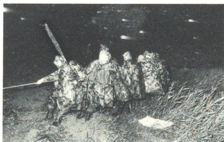
Nach dem Sprung aufs Festland hielten die Rekruten die Fähre mit vereinten Kräften fest, bis sie gesichert werden konnte.