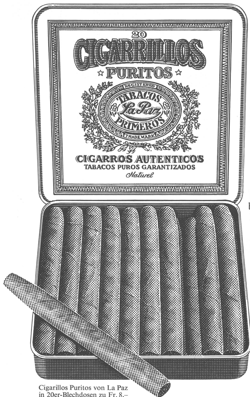
Cigarillos Puritos von La Paz in 20er-Blehdosen zu Fr. 8.- Nur im guten Fachhandel.

Cigarillos geniessen in Kennerkreisen wenig Zutrauen. Das oft zu Recht. Denn das Verhältnis von Innengut zu Um- und Deckblatt kann bei kleinen Cigarren die Geschmacksharmonie beeinträchtigen, da für eine ausgewogene Mischung kaum noch Raum bleibt.