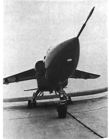
Kampfflugzeug «Adler» – ein gemeinsames rumänisch-jugoslawisches Fabrikat der 70er Jahren.

Nach einer Zusammenstellung des Londoner Instituts für Strategische Fragen (Ende 1979), verfügt Rumänien bei einer Gesamtbevölkerung von 21,6 Millionen Einwohnern zur Zeit über eine Streitmacht von 180 000 Mann. Davon sind 140 000 Mann beim Heer, das gegliedert ist in 8 Infanterie-, 2 Gebirgs- und 2 Panzer-Divisionen. Die eher bescheidene Kriegsmarine zählt 10 500 Mann. Die Luftwaffe verfügt über 30 000 Mann und 437 Kampfflugzeuge mehrheitlich sowjetischen Fabrikats. – Der Grundwehrdienst beim Heer dauert 16 Monate, bei der Kriegsmarine zwei Jahre, wobei für Spezialkategorien eine längere Dienstzeit festgelegt wurde. – Für den Offiziersnachwuchs sorgen fünf Kadettenschulen in Rumänien. Das Studium beginnt hier ab der neunten Klasse und dauert vier Jahre. Danach gehen die Kadetten grösstenteils an eine der zahlreichen Offiziershochschulen des Landes. – Oberbefehlshaber der rumänischen Volksarmee ist Nicolae Ceausescu, Generalsekretär der rumänischen Kommunistischen Partei und Staatspräsident der Sozialistischen Republik Rumäniens. Die oberste politische Leitung der Volksarmee führt der 1964 gebildete Oberste Politische Rat