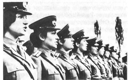
Weibliche Offiziere der Rumänischen Volksarmee