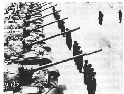
Die Panzertruppen der Rumänischen Volksarmee in ihrer neuen, schwarzen Uniform, die aus der Zeit der königlichen Armee stammt. (Die Panzer sind sowjetische Kampfwagen des Typs T-54)

gefördert. Die auf die Traditionen der königlichen Armee zurückgehenden nationalen Besonderheiten bei Uniformen und im Verhalten