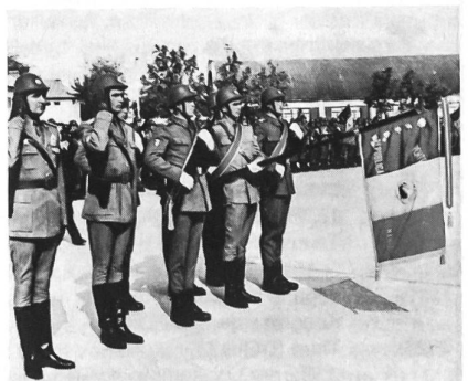
Seit 1973 haben die rumänischen Truppen neue Stahlhelme: Stahlhelme die einst die königliche Armee trug. Auch das Salutieren wird nicht mehr nach sowjetischem Muster geübt, sondern nach den Gepflogenheiten der Vorkriegsarmee.