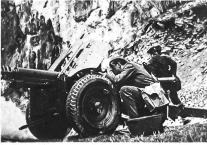
Rumänische Gebirgsjäger – während der Stalin-Ära als Truppengattung abgeschafft – mit ihrem Gebirgsgeschütz, rumänisches Fabrikat, in den Karpaten.

kommen wieder zur Geltung und die politische Erziehung der Soldaten dient der Entwicklung einer nationalistischen und sozialistischen Gesinnung. Als der Warschauer Pakt am 21. August 1968 die sich gegen den politischen Einfluss Moskaus auflehrende ČSSR militärisch besetzte, hielt sich die Rumänische Volksarmee von dieser «brüderlichen Hilfe» fern. Ceauscuscus These, dass rumänische Soldaten ausserhalb der eigenen Grenzen nichts zu suchen haben und dass andererseits fremde Truppen in Rumänien nichts verloren hätten, wurde von der rumänischen Partei- und Armeeführung konsequent vertreten. So nahm Rumäniens Volksarmee in den siebziger Jahren an Warschauer-Pakt-Manövern, lediglich mit kleineren Offiziersabteilungen teil. Sowjetische und verbündete Offiziere konnten in Rumänien