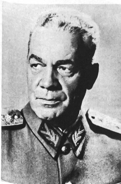
Armeegeneral Emil Bodnaras, Rumänien's Kriegsminister zwischen 1948 und 1957.

Kurzgefasste Darstellung der Armeen im sozialistischen Lager von O.B. (5)