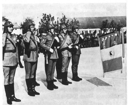
Seit 1973 haben die rumänischen Truppen neue Stahlhelme: Stahlhelme die einst die königliche Armee trug. Auch das Salutieren wird nicht mehr nach sowjetischem Muster geübt, sondern nach den Gepflogenheiten der Vorkriegsarmee.