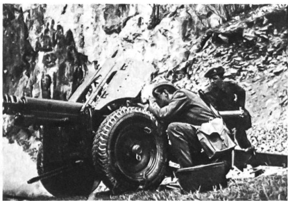
Rumänische Gebirgsjäger – während der Stalin-Ära als Truppengattung abgeschafft – mit ihrem Gebirgsgeschütz, rumänisches Fabrikat, in den Karpaten.

kommen wieder zur Geltung und die politische Erziehung der Soldaten dient der Entwicklung einer nationalistischen und sozialistischen Gesinnung. Als der Warschauer Pakt am 21. August 1968 die sich gegen den politischen Einfluss Moskaus auflehrende ČSSR militärisch besetzte, hielt sich die Rumänische Volksarmee von dieser «brüderlichen Hilfe» fern. Ceausescu These, dass rumänische Soldaten ausserhalb der eigenen Grenzen nichts zu suchen haben und dass andererseits fremde Truppen in Rumänien nichts verloren hätten, wurde von der rumänischen Partei- und Armee-führung konsequent vertreten. So nahm Rumäniens Volksarmee in den siebziger Jahren an Warschauer-Pakt-Manövern, lediglich mit kleineren Offiziersabteilungen teil. Sowjetische und verbündete Offiziere konnten in Rumänien