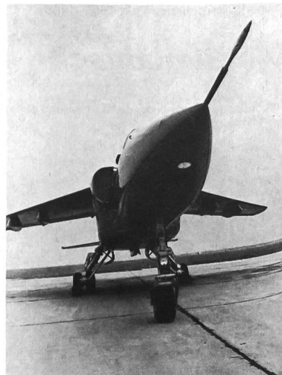
Kampfflugzeug «Adler» – ein gemeinsames rumänisch-jugoslawisches Fabrikat der 70er Jahren.

aus. In den Divisionen gibt es Politische Räte, in den Regimentern Parteikomitees. Die Rumänische Kommunistische Partei ist allgegenwärtig in der Volksarmee. Nach offiziellen Angaben sind mehr als 90% der Offiziere, 50% der Militärangehörigen (Fähnliche) und 70% der Unteroffiziere Mitglieder der RKP. Alle jungen Soldaten gehören dem Kommunistischen Jugendverband an.