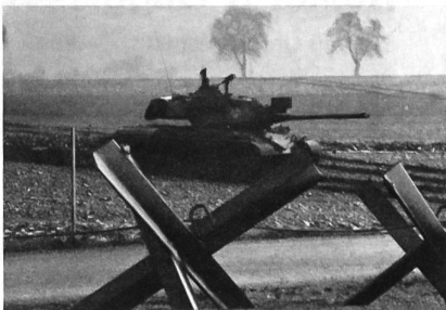
Bei der Raumverteidigungsübung 79 wurden die neuen Panzersperren erstmals der Öffentlichkeit präsentiert.

Bei der Raumverteidigungsübung 79 hat man sie zum erstenmal gesehen, die «Igel mit Stacheln aus Stahl», und sie haben sich bei Truppenversuchen und eben bei den Manövern so gut bewährt, dass sie nun in grosser Zahl hergestellt und zur Verstärkung der Panzerabwehr eingesetzt werden sollen. Es handelt sich um eine verblüffend einfache «Eigenproduktion» der Pioniere des österreichischen Bundesheeres, in der Herstellung relativ billig — etwa 4000 Schilling pro Stück — und äusserst wirkungsvoll: Ein solcher «Igel» besteht aus drei 2,5 m langen Stahlträgern, die in der Mitte zusammengeschweisst sind und ein Gesamtgewicht von 465 kg haben. Der Igel steht in jeder Position auf drei Beinen, wobei die restlichen drei Träger-