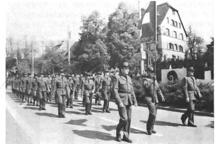
Vorbeimarsch in St. Jakob