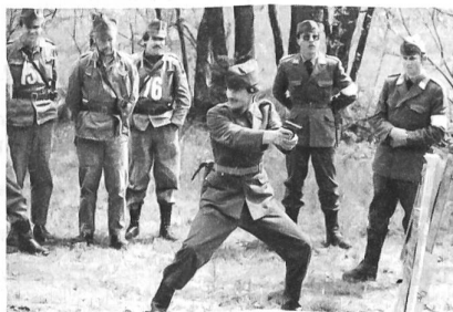
...und treffen immer ins Schwarze!