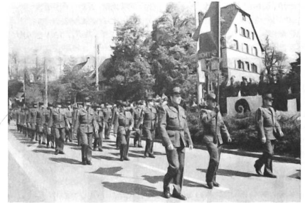
Vorbeimarsch in St. Jakob