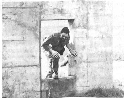
Feldweibel kennen keine Hindernisse...

Der Samstag stand ganz im Zeichen der Wettkämpfe, und zwar des fachtechnischen Feldweibelwettkampfes auf den Sportanlagen St. Jakob, den Schiesskonkurrenzen auf der