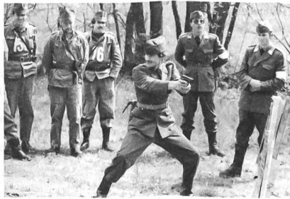
...und treffen immer ins Schwarze!