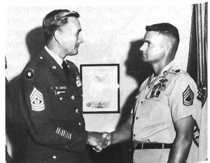
«Sergeant-Major of the Army» (Spitzendienstgrad) im Gespräch mit einem «Sergeant first class» (Oberfeldwebel).

US Army bereits 1955 die «Specialists» ein. Die Besoldung eines «Specialist 5» entspricht der eines Sergeanten, entsprechend verhält es sich bis einschliesslich der Gruppe E-7. Bei Vorliegen der allgemeinen Qualifikationen ist jederzeit ein Laufbahnwechsel möglich. Neuerdings hat man jedoch die oberen Spezialistengrade stark gekürzt und bemüht sich die entsprechenden Stellen mit Unteroffizieren zu besetzen, da in der Regel auch derartige Spezialisten Menschenführungsaufgaben haben. Trotzdem ist diese Lösung als recht günstig zu betrachten, da nicht jeder fachlich auch qualifizierte Soldat gleichzeitig eine geeignete Führungskraft und so anderweitig geeignetes und benötigtes Personal gehalten wird.