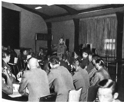
General diskutiert mit höheren Unterführern.

Ein weiterer Weg des laufbahnmässigen Weiterkommens ist der Zweig der «Warrant officers» (etwa technische/administrative Fachoffiziere). Bei Qualifikation für eine solche hochspezialisierte Verwendung kann ein Dienstgrad erreicht werden, der dem Major entspricht. Besonders Hubschrauberpiloten gehören oftmals diesem Zweig an, der sich weder voll den Offizieren, noch den Unteroffizieren zuordnen lässt.