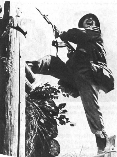
Einzelkämpfer-Ausbildung in der Volksarmee