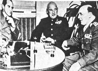
General Heliodor Pika, stellv. Generalstabschef der ČSR-Armee (rechts im Bild) mit jugoslawischen und sowjetischen Diplomaten 1946. Nach 1948 wurde Pika verhaftet, als Landesverräter (unschuldig) angeklagt und 1949 durch den Strang hingerichtet