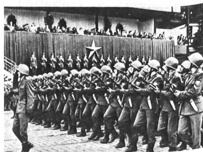
Die ČSSR-Armee während einer Parade 1975