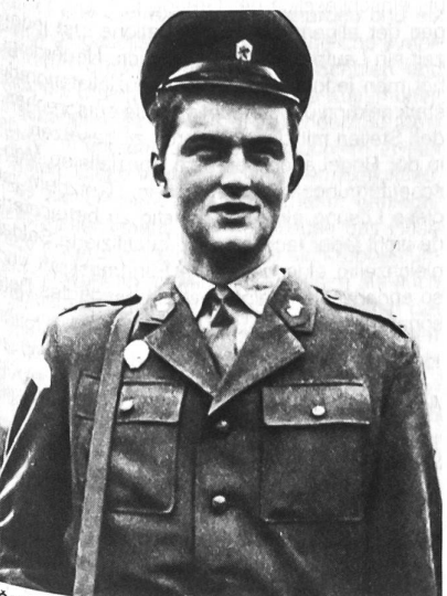
ČSSR-Grenzwächter in den siebziger Jahren

unterwarf man einer politischen Säuberung: in der Folge wurden 11 000 Offiziere und 30 000 Unteroffiziere entlassen. Erst 1970 begann die Reorganisation der Streitkräfte. Es dauerte Jahre, bis die Armee – wenigstens nach aussen – erneut voll in den Warschauer Pakt integriert werden konnte.