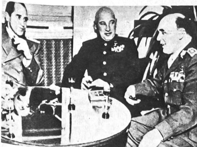
General Heliodor Pika, stellv. Generalstabschef der ČSR-Armee (rechts im Bild) mit jugoslawischen und sowjetischen Diplomaten 1946. Nach 1948 wurde Pika verhaftet, als Landesverräter (unschuldig) angeklagt und 1949 durch den Strang hingerichtet