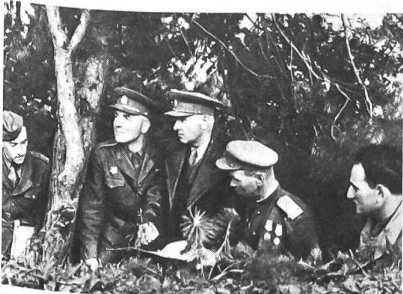
General Ludvik Svoboda (dritter von links) auf seinem Gefechtsstand während der Kämpfe um den Dukla-Pass im Oktober 1944