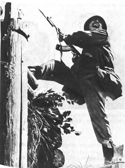
Einzelkämpfer-Ausbildung in der Volksarmee