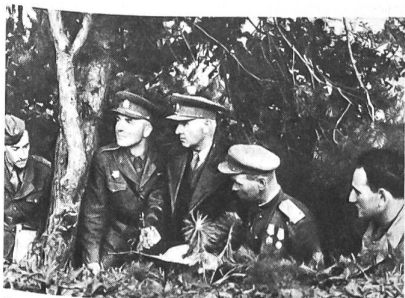
General Ludvik Svoboda (dritter von links) auf seinem Gefechtsstand während der Kämpfe um den Dukla-Pass im Oktober 1944