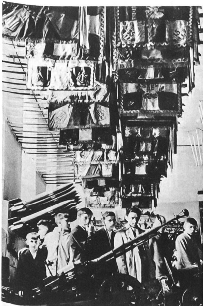
Traditionspflege bei Polens Jugend hinsichtlich der Geschichte des polnischen Militärwesens. Besuch in einem Kriegsmuseum.