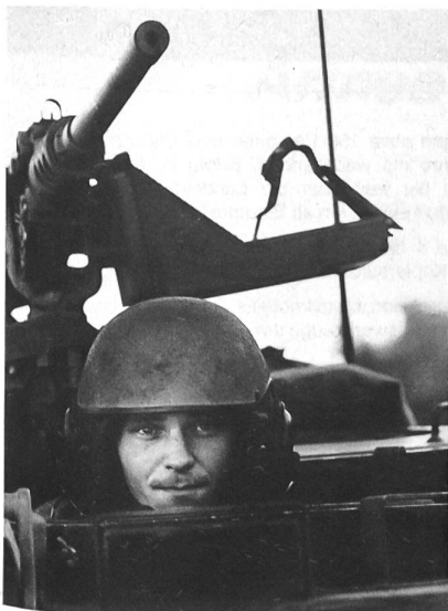
Panzerbesatzungen sind besonders stark belastet

schaft ein weiteres verzerrtes Beispiel übertriebenen Leistungsdenkens, welches in seinen Auswirkungen den eigentlichen Forderungen überhaupt nicht entspricht.