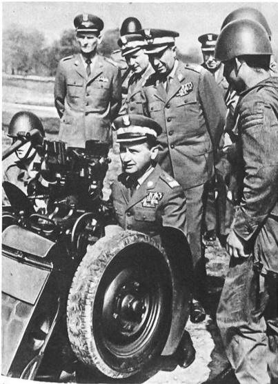
Armeegeneral Wojciech Jaruzelski, seit 1968 Minister für Nationale Verteidigung, besucht ein Artillerie-Regiment.