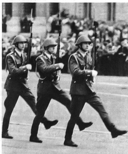
Traditionspflege in der Nationalen Volksarmee. Der preussische Stechschritt anlässlich der Wachablösung am Berliner «Mahnmal gegen Krieg und Militarismus». Der Stahlhelm in der Nationalen Volksarmee stammt noch aus der Hitler-Zeit. Während des Krieges wollte man in der Wehrmacht eine neuartige Kopfbedeckung einführen, doch Hitler verteidigte den alten, aus dem I. Weltkrieg stammenden Stahlhelm mit dem Argument: Er passt besser zum deutschen Soldat.