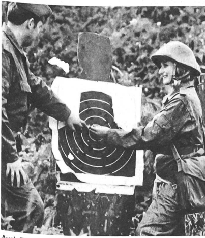
Auch Frauen machen in der Nationalen Volksarmee Dienst – auf freiwilliger Basis.