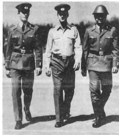
Neue Uniformen in der Nationalen Volksarmee.

eine besondere Rolle. Mit ihrer Hilfe will man bei Armee und Bevölkerung die Loyalität zur Staatsführung und zur Sowjetunion wecken und stärken. Die Tradition soll ferner Sicherheit und politische Orientierung vermitteln. Was heisst jedoch Traditionspflege in der Armee jenes Staates, der 1949 auf Geheiss der Sowjetunion als Bruch mit aller nationalen, historischen Vergangenheit gegründet wurde? Die Kommunistische Partei der DDR, die SED (So-