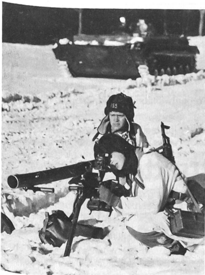
Panzerjäger der Nationalen Volksarmee mit rücksichtslosem Geschütz.

Münchener Räterepublik, die Rote Ruhrarmee» usw. Ferner zählen zu den Traditionsverbänden der Nationalen Volksarmee der Rote Frontkämpferbund, die kommunistischen Widerstandsgruppen in den Hitlerschen KZ und nicht zuletzt die in Spanien kämpfenden deutschen «Interbrigadisten» bzw. die deutschen Partisanen im Zweiten Weltkrieg.