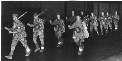
Mitternacht ist vorbei – das Ziel (die Kaserne Brugg) erreicht.