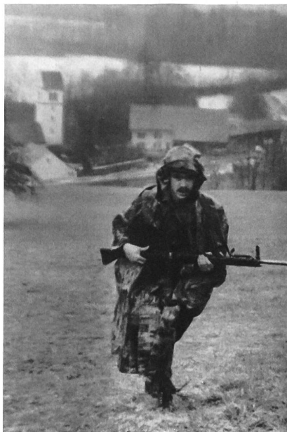
Von der Kirche Kirchbözberg (Bild) her ging es kriegsmässig – und in strömendem Regen – bergan Richtung Oberbözberg-Bürersteig.