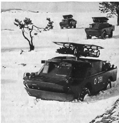
BRDM-2 (SA-9 / Gaskin) (Bild 1)

Flugabwehrsystem mit 2 x 2 oder 2 x 1 Abschussbehälter, drehbarer Aufbau, Abschussbehälter schwenkbar, wahrscheinlich verbessertes IR-Flugkörpersystem SA-7 "Grail"