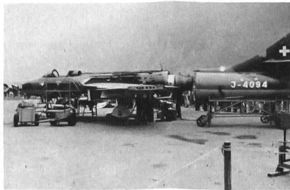
Revisionsarbeiten an einem Hunter. 10 Fachspezialistengruppen sind daran beteiligt. Der Arbeitsablauf ist im 24-Stunden-Betrieb gewährleistet.