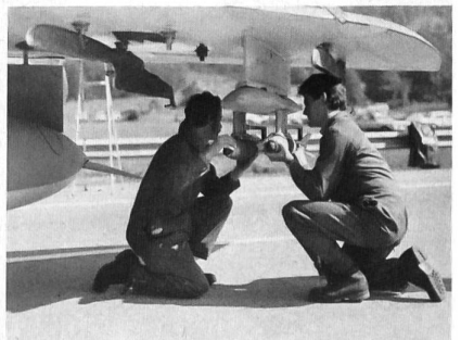
Fliegersoldaten bestücken einen Hunter mit Übungsbomben.