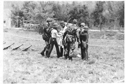
Die Fliegersoldaten und die Glarner Jugend verstehen sich ausgezeichnet.