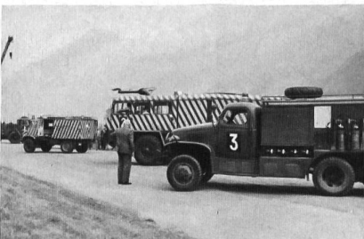
Unfall-Pikettfahrzeuge. Schnell und wirkungsvoll wenn ein Zwischenfall auf der Piste eintreten sollte.