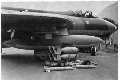
Der Hunter in der Rolle als Erdkampfflugzeug. Er kann Bomben und Raketen mitführen. Ausserdem besitzt er 4 30-mm-Kanonen.