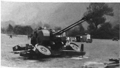
Radargesteuertes 35-mm-Fliegerabwehrgeschütz. Zwillingsrohr. Wirkungsbereich: etwa 4000 Meter.