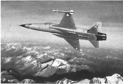
Raumschutzbjäger Tiger über den Schweizer Alpen. Militärflugdienst