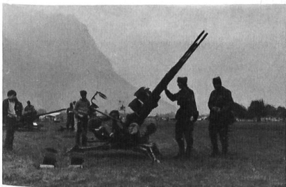
20-mm-Drilling mit manueller Steuerung für den Flugplatzschutz gegen feindliche Fliegerangriffe. Wirkungsbereich etwa 1500 m.

Sie ist das Bauunternehmen der Flpl Abt. Sie legt Pisten und Rollwege an, baut Unterstände und Geländeverstärkungen. Ferner verlegt sie Minenfelder und bereitet Zerstörungen vor. Ein umfangreiches Arsenal von Geräten, angefangen beim einfachen Handwerkzeug, bis zur modernen Baumaschine machen diese Einheit zu einem wirkungsvollen Instrument. Das Können bringen die Wehrmänner aus den einschlägigen Berufen der Baubranche mit.