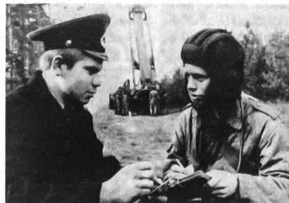
«Gemeinsame Ausbildung mit den Genossen vom «Regiment nebenan». – Propagandafoto, die zeigen soll, wie Soldaten der DDR und der SU bei Übungen und in der Freizeit «brüderliche Waffengemeinschaft» praktizieren.