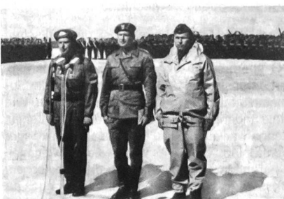
Die Kommandeure der sowjetischen, polnischen und ost-deutschen Marinestreitkräfte in der Ostsee beim Rapport nach abgeschlossener Übung.