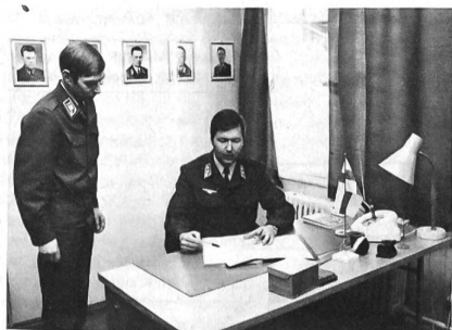
Höherer Unterführer bei der Besprechung mit einem Kommandanten

struktion bietet die rechtliche Grundlage für die Zahlung eines Gehalts, ebenso gibt es für den Zeitraum des Schulbesuches ein zusätzliches Tagegeld. Überstunden werden nach den Prinzipien des staatlichen Arbeitszeitgesetzes den Soldaten voll vergütet.