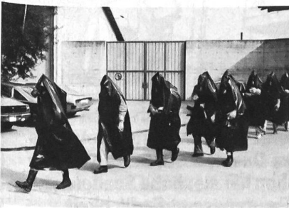
Die Übungsteilnehmer auf dem «Marsch in die Gaskammer».

Gemeinsame Übung des Unteroffiziersvereins und des Artillerievereins Frauenfeld