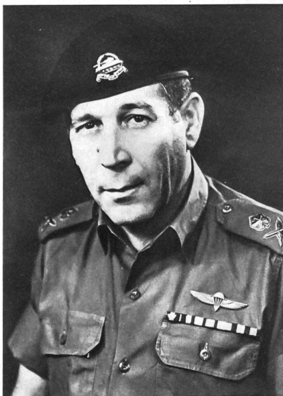
Generalmajor Israel Tal