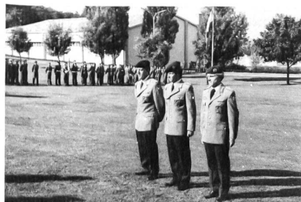
Der Gesamtsieger im Einzelklassement – Deutschland I.