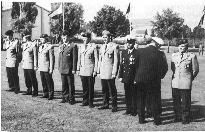
Die Mannschaften Deutschland I, II und III gewinnen das Nationenklassement für die Bundesrepublik Deutschland.