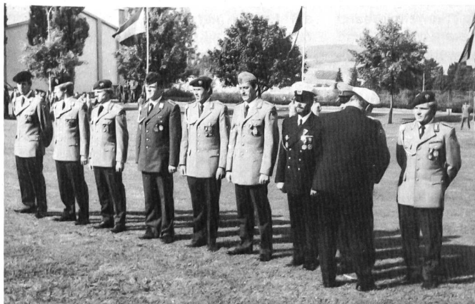
Die Mannschaften Deutschland I, II und III gewinnen das Nationenklassement für die Bundesrepublik Deutschland.