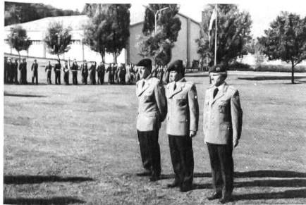
Der Gesamtsieger im Einzelklassement – Deutschland I.