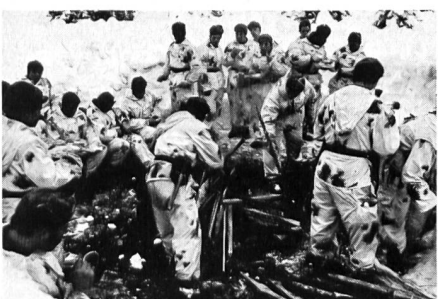
Gebirgs- und Winterkampfschule: Pause bei der Winterausbildung.

von Fragen der taktischen und technischen Weiterentwicklung auf den Gebieten des Gebirgs- und Winterkampfes. Hierzu wird die Entwicklung bei den – derzeit nur noch wenigen – ausländischen Gebirgstruppen aufmerksam verfolgt, Literatur und Truppenversuche ausgewertet. Vorschriften über den Gebirgs- und Winterkampf, aber auch Gutachten zu artverwandten, anderen Fragenkomplexen erteilen den mit Ausbildung und Führung betrauten Offizieren und Soldaten konkrete Anweisungen und Hilfen.