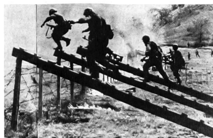
Ungarische Infanterie überwindet im Sturm Drahtverhau mit Holzstegen.