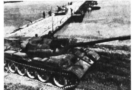
Sowjetische Pz T-72 überqueren die Donau auf Pontonbrücke.