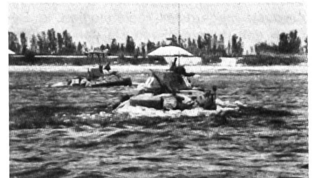
Schwimmfähige SPz beim Durchwaten eines Flusses.