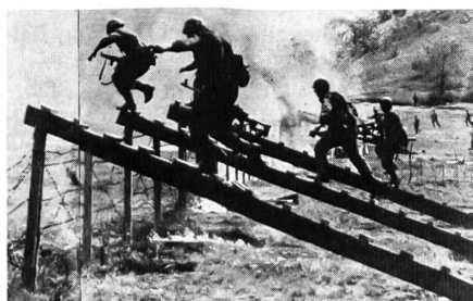
Ungarische Infanterie überwindet im Sturm Drahtverhau mit Holzstegen.