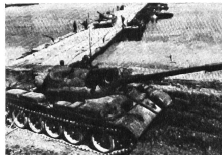
Sowjetische Pz T-72 überqueren die Donau auf Pontonbrücke.