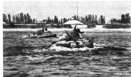
Schwimmfähige SPz beim Durchwaten eines Flusses.