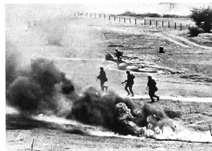
Zusammenwirken Infanterie und Artillerie