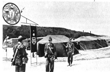
Wachtposten vor dem in fünf Sprachen gehaltenen Manöversignet «Schild 79».