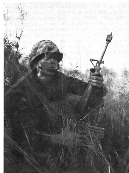
Neuerdings sind die «Marines» stark im nördlichen Europa vertreten.

menarbeit zwischen den Verbänden der verschiedenen Nationen erprobt und gefestigt wurden.