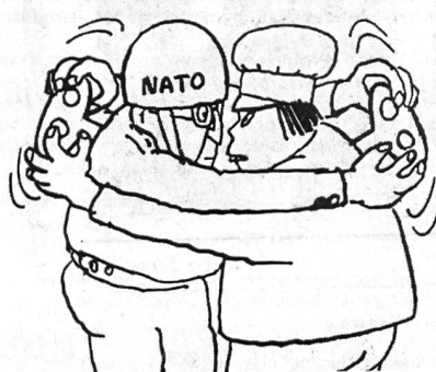
Diese ursprünglich aus Bulgarien stammende Zeichnung, die in der UdSSR verbreitet wurde, zeigt die Wechselbeziehung Peking-Westen.