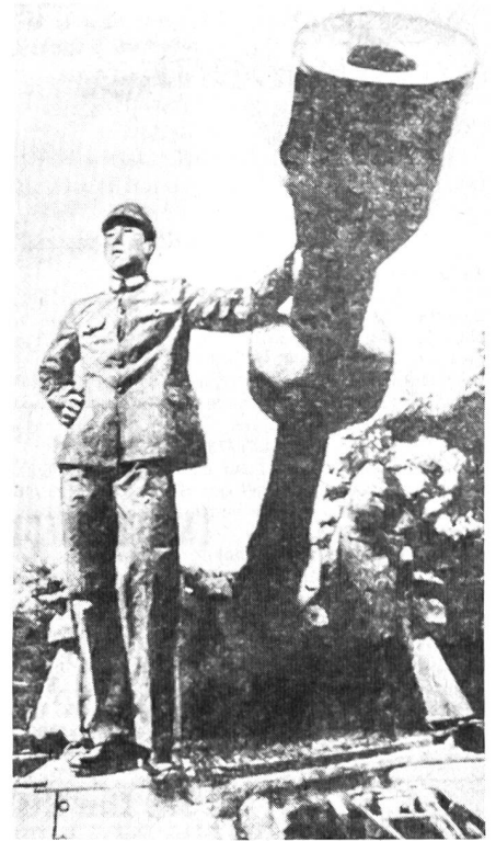
A & B. Solche aus der westlichen Presse übernommenen Bilder erschienen in allen Sowjetorganen.

«Die Verbindung.» So wird Pekings Bündnis mit Amerika veranschaulicht. Die Telefonistin (Kalter Krieg) am Stuhl des «Antikommunismus» verbindet «Peking» und «Washington».