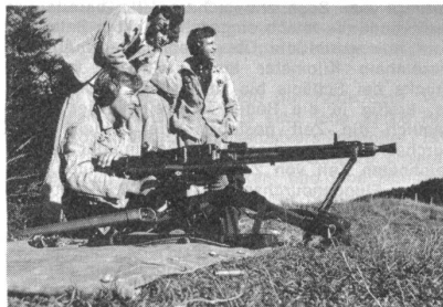
Jungschützen beim Schiessen am Mg 51