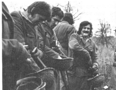
Zwar nicht mit dem gewünschten Haarschnitt, aber im allgemeinen mit gutem Willen absolvieren die Landwehr(= Miliz-)soldaten ihre Truppenübungen (= Wiederholungskurse).