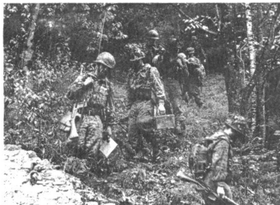
Die Hauptlast des Kampfes in einem Schlüsselraum tragen die Soldaten der raumgebundenen Landwehr, die speziell für diesen Grundauftrag ausgebildet und organisiert sind.