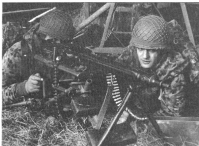
Vereinfachte Kampfführung und Einsatz in einem bekannten Einsatzraum sind wichtige Faktoren der Raumverteidigung.

Die raumgebundene Landwehr besteht aus Landwehrregimentern, die im Sinne der Raumverteidigung für jeweils einen bestimmten Raum taktisch verantwortlich sind und über eine darauf abgestimmte Gliederung verfügen. Die Landwehrregimenter setzen sich je nach taktischer Absicht in der Zone aus Landwehrbataillonen und Sperrereinheiten (für feste Anlagen) für die Verteidigung von Schlüsselräumen sowie aus leichten Landwehrbataillonen für die Raumsicherung (Grenzüberwachung und Jagdkampf) zusammen. Die raumgebundene Landwehr zählt zunächst 26 Landwehrregimenter mit einem geringen Anteil an Aktivkader, die Masse bildet das Re-