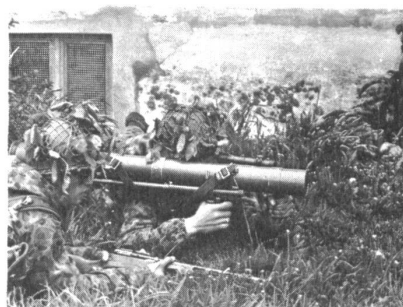
... und Panzerabwehrrohre sind (über)lebenswichtig in der Raumverteidigung.