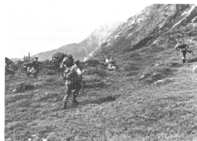
Der Widerstand wird nicht erst im Gebirge aufgenommen, aber verteidigt wird natürlich auch dort.

servepersonal. Im Frieden gibt es nur die Landwehr-Stammregimenter (siehe weiter oben).