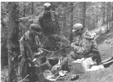
Die Soldaten eines Jagdkommandos sind häufig auf sich allein gestellt. Sie bilden das bewegliche Element der Raumsicherung.