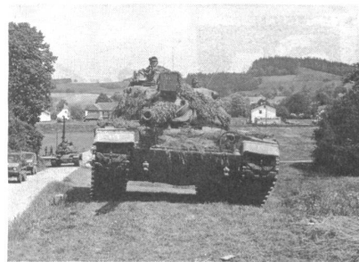
Die Gegenschlagskräfte rekrutieren sich ausschliesslich aus der Bereitschaftstruppe (auf dem Bild ein M 60 A 1 amerikanischer Provenienz).