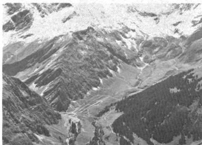
Das Schiessplatzgelände aus der Vogelperspektive

Militärische, touristische und alpwirtschaftliche Bedürfnisse unter einem Hut