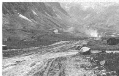
Und so sieht der Platz für den Panzermann aus

In der ersten Junihälfte konnte im Sernfital im Glarnerland der Schiessplatz Wichlen offiziell übernommen werden. Wichlen ist für den Ausbildungsstand der Armee von hoher Bedeutung. Es ist einer der fünf grössten Übungsplätze der Schweiz; für die mechanisierten Truppen ist es einer der drei grössten Plätze. Die Übernahme ist aus zwei Gründen bemerkenswert. Erstens konnte eine fast 20 Jahre währende Vor- und Leidensgeschichte abgeschlossen werden — so erfolgreich übrigens, dass die direkt Betroffenen mit dem ausgehandelten Ergebnis mehr als zufrieden sind. Zweitens ist es im Glarnerland gelungen dank enger Zusammenarbeit der zivilen und militärischen Stellen nicht nur einen Panzer- und Schiessplatz zu bauen, sondern auch die Infrastruktur eines ganzen Tales entscheidend zu verbessern. Die Schaffung des Schiessplatzes hat nicht nur der Gemeinde neue Mittel zugeführt und den Ausbau von Strassen und Wanderwegen gefördert, sondern auch die Melioration grosser Alpgebiete ermöglicht.