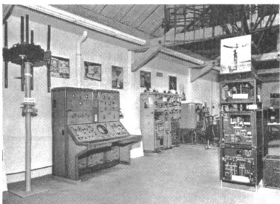
Peiler, Konsolen und das Radargerät LGR 1