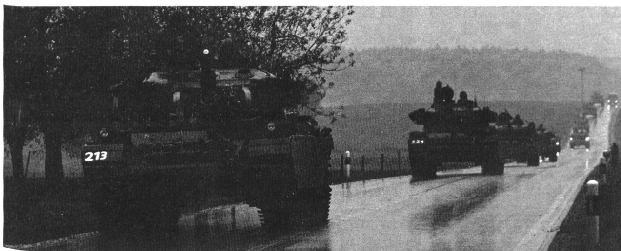
Panzermarsch im Regen