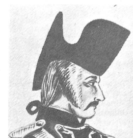
«Ein Gemeiner vom 3ten Zuzug in der Uniform der ehemaligen Schweizer Garde» aus Paris. Nachzeichnung von A. Pochon nach einem Aquarell von M. Heusler. Schweizer Landesbibliothek Bern.