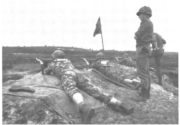
Die Nidwaldner Kameraden versuchen es Wilhelm Tell gleichzutun