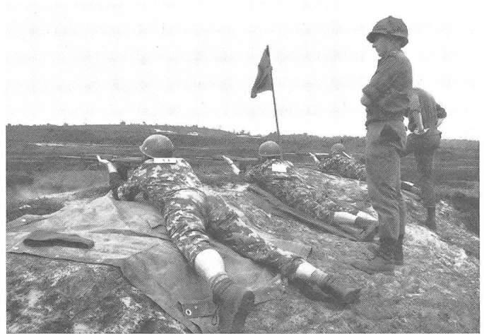
Die Nidwaldner Kameraden versuchen es Wilhelm Tell gleichzutun