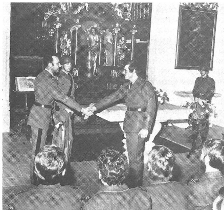
Bild: Die Absolventen der Bremgartner G UOG 36 wurden in der Klosterkirche Hermetschwil von Schulkommandant Oberstleutnant Willi Baer mit Handschlag über der Schweizer Fahne zu Unteroffizieren befördert.

Als erste Truppe konnte im Januar die Mob L Flab Abt 12 den neuen Flab-Schiessplatz S-chanf benutzen. Vorläufig sind von dem 50-Millionen-Franken-Projekt erst die modernen Schiessanlagen in Betrieb, während die Gebäulichkeiten im Herbst bezugsbereit sein werden.